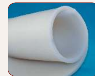
פסי סיליקון מלבניים